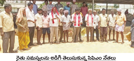
రైతులకు కనీస సౌకర్యాల కల్పించడంలో రాష్ట్ర ప్రభుత్వం విఫలం