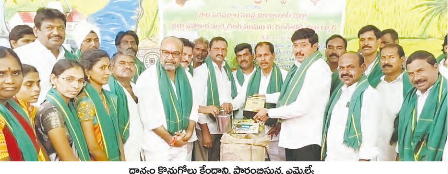
ధాన్యం కొనుగోలు కేంద్రాన్ని ప్రారంభిస్తున్న ఎమ్మెల్యే