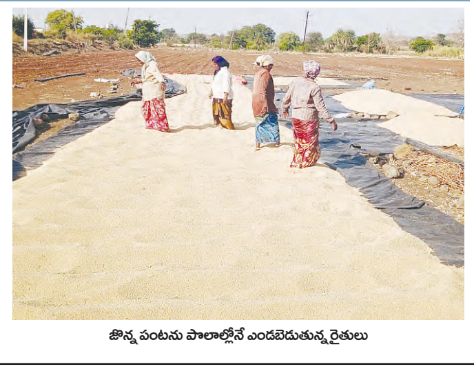
జొన్న పంటను పాలాల్లోనే ఎండబెడుతున్న రైతులు

కొనుగోలు కేంద్రాలు లేక జొన్న రైతుల అగచాట్లు దిగుబడిని కల్లాల్లో అరబెట్టుకుంటున్నామని ఆవేదన అకాల వర్షం భయంతో పైవేటి వ్యాపారులకు అమ్మకుంటున్నామని వెల్లడి మద్దతు ధరలో కోతలు పెడుతున్నారని ఆందోళన జొన్న కొనుగోలు కేంద్రం ఏర్పాటుచేయాలని విజ్ఞప్తి