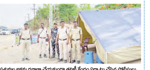
పశువుల అక్రమ రవాణా చేయకుండా తనిఖీ కేంద్రం ఏర్పాటు చేసిన పోలీసులు

బాలానగర్ మే 3 ప్రభాతవార్త: బాలానగర్ మండల కేంద్రంలోని స్థానిక పోలీస్ స్టేషన్ మేరకు 44వ జాతీయ రహదారిపై జిల్లా ఎస్పీ సునీత ఆదేశాల మేరకు బళ్లెపల్లి మండల సందర్భంగా పశువులను అక్రమంగా తరలించకుండా ఎన్నో తెనిగే ఆదివారం తనిఖీ కేంద్రం ఏర్పాటు చేశారు. ఈ సందర్భంగా ఎన్నో మాట్లాడుతూ అనుమతులు లేకుండా పశువులను అక్రమ రవాణా చేసే కఠిన చర్యలు తీసుకుంటామన్నారు. పశువులను తరలించే వాహనదారులు తప్పనిసరిగా అనుమతి పత్రాలు పొందిన తర్వాతే పశువుల రవాణా చేయాలన్నారు. ఈ తనిఖీలలో బాలానగర్ స్టాక పోలీస్ స్టేషన్ సిబ్బంది పాల్గొన్నారు.