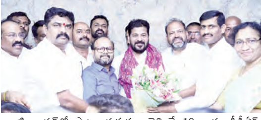
సిపిఎన్ ఉద్యోగుల సమస్యలను పరిష్కరించాలి