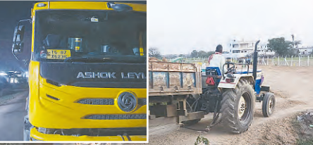
బైర్ ఖాన్ పబ్లిక్ మిట్టం అక్రమంగా మట్టి తరలిస్తున్న వాహనాలు (ఇన్సైటి) అర్బరాత్రి గ్రామస్థులు అడ్డుకున్న వాహనం

అక్రమ మట్టి రవాణాను అడ్డుకున్న గ్రామస్థులు సాగుకులను బెదిరించి వాహనాలను తరలించిన మాఫియా డీ పోలీసులకు సమాచారం ఇచ్చినా సకాలంలో రాలేదని ఆందోళకారుల ఆగ్రహం