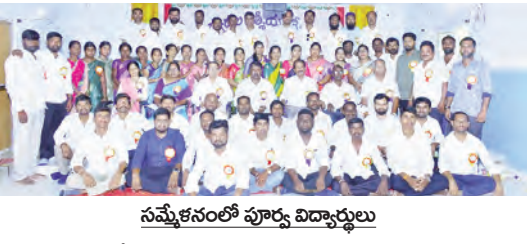
సమ్మేళనంలో పూర్వ విద్యార్థులు