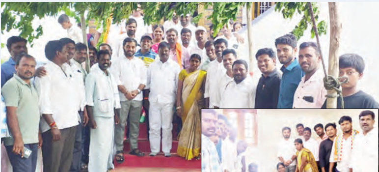
ఇందిరమ్మ ఇంటిని ప్రారంభించిన సొంత పన్నెండు అందిరమ్మ ఇళ్లకు