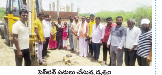
పైవెలిన పనులు చేస్తున్న డిప్యూటీ